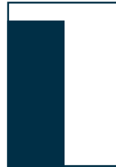
1/2 Seite hoch 112 x 285 mm