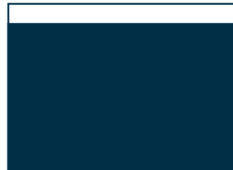
2/1 Seite (nur in der Heftmitte) 458 x 285 mm (Voll)