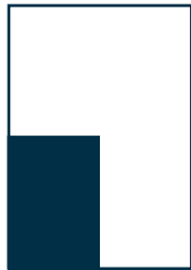
1/4 Seite Eckfeld 112 x 162 mm