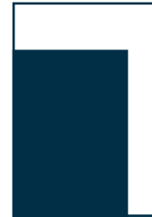
1/2 Seite Eckfeld 170 x 190 mm