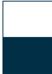
1/2 Seite quer 229 x 142 mm