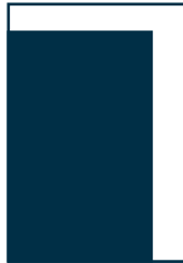
3/4 Seite hoch 170 x 285 mm