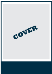
Banner Titelseite 228 x 70 mm